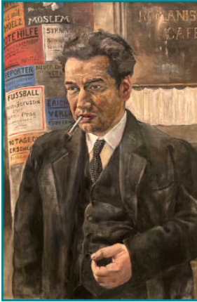
Egon Erwin Kisch