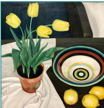
Stilleben mit Tulpen

Mit Beginn der Nazizeit wurde die Vielfalt der Kunst drastisch reduziert. Die politisch kritische, veristische Malerei wurde als „entartet“ gebrandmarkt, die realistische Malerei im altmeisterlichen Stil dagegen gefördert, wenn auch an den Bildern der „Neuen Sachlichkeit“ der erwünschte Heroismus etwas vermisst wurde. Ein prägnantes, rein technisch hervorragend gemaltes Beispiel regime-