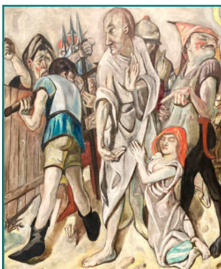
Christus und die Sünderin