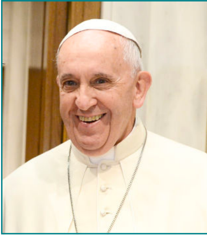
Papst Franziskus

len Predigten und Stellungnahmen ausgedrückt. Großes Aufsehen löste aber aus, dass er Ende November forderte, man solle juristisch prüfen, ob es sich bei dem israelischen Militäreinsatz im Gazastreifen um einen Genozid, einen Völkermord, handle. Der Zentralrat der Juden in Deutschland war empört. Scharfe Kritik kam auch von der erwähnten Rabbinerkonferenz. Sie stellte fest, Israel führe einen Verteidigungskrieg gegen einen barbarischen Feind. Militärische Maßnahmen zur Selbstverteidigung seien kein Völkermord. Dieser Begriff werde propagandistisch benutzt, um Verantwortung von den Tätern auf die Opfer zu verlagern. Völkermord sei das, was die Hamas versucht habe und weiterhin versuche.